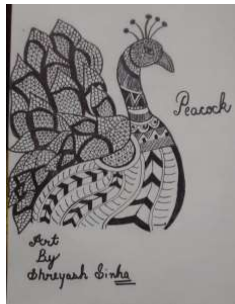
SHREYASH SINHA, VIIIF