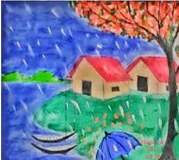
HARSH RAJ, VIII C